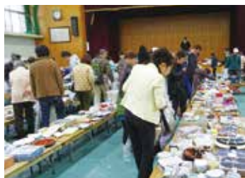
板橋地域女性会バザー