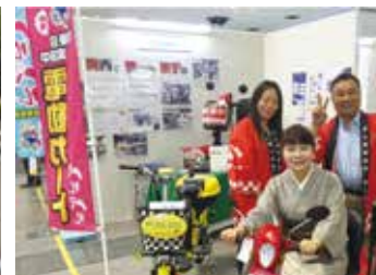
中信ビジネスフェア