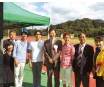
京都府人権啓発イメージソング 第二弾！ 「えがおのおくりもの」を初お披露目