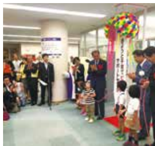
開所式には子ども達も笑顔で参加