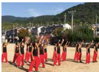
日野 婦人会の文化祭