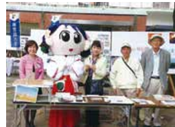
第10回 向島ニュータウン 秋の祭典