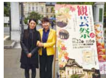
府庁 旧本館 観芸祭