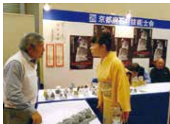
京都ものづくりフェア