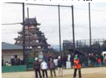
伏見区老人クラブ連合会 グランドゴルフ大会