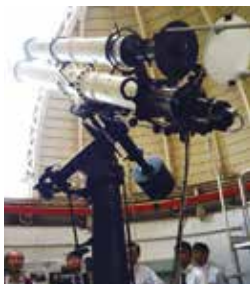
国内3番目の口径の45cm屈折望遠鏡

たり、存続の機運も高まっています。皆さまに愛される場になるよう心から願っています。