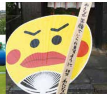
長建寺の辨天祭で火焚串にご祈願