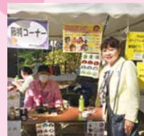
深草ふれあいプラザ

各学区や各種団体、警察、消防、エコまちステーション、人づくり21世紀委員会、児童館など、多くの皆さまのお陰で賑やかに開催。ステージは藤袴が香り、PTAの皆さまの司会進行がうまくてびっくり。撮影した写真で作る缶バッジ、手話体験など、色々工夫された催しでした。