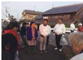
鳥羽ライオンズクラブと下鳥羽 地域女性会の皆さまによる清掃活動