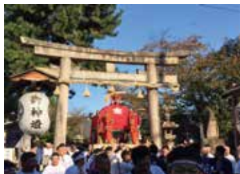
與杼神社神輿渡御