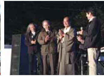
第4回 花山天文台 野外コンサート