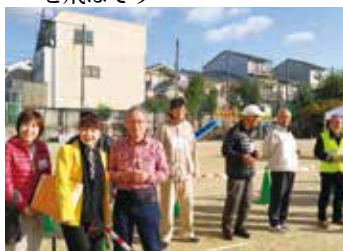
深草で竹とんぼ を飛ばそう ギネス認定