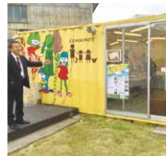
中古コンテナを使った交流空間

佐賀県のNPO「まちづくり機構ユマニテさが」では、縮退する商店街近くの空き地に、中古コンテナを使った交流空間や貸しオフィスなどをつくり、街なかの回遊性を促す仕組みや運営を試行する社会実験を実行。佐賀市街地活性化基本計画を実現するため