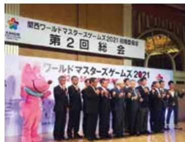
公式夕食会では機運が高まりました

「関西ワールドマスタースゲームズ2021」の組織委員会第2回総会に出席しました。1985年に始まった4年に1度のスポーツの祭典で2021年5月にアジアで初めて、しかも関西を中心に開催されます。大会は、32競技55種目が行われ、原則30歳以上であれば