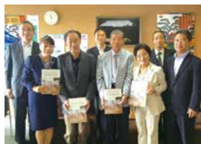
詳細な記録に担当部局の職員も驚いていました

災害を忘れず、地域防災力向上のため被害に遭った住民が写真や資料を収集 「下鳥羽災害記録」を発刊