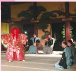
スポーツ・文化・ワールド・ フォーラム