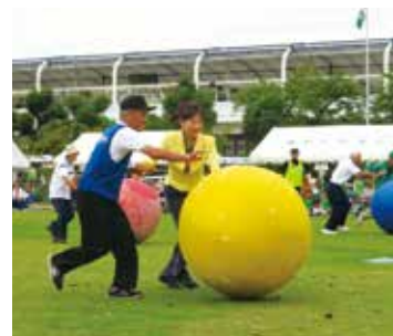
淀学区 スポーツカーニバル JRA京都競馬場「みどりの広場」

淀・淀南・納所の3学区の皆さま、淀ライオンズクラブによる清掃活動に参加。淀城跡公園、京阪淀駅前ロータリーを清掃。