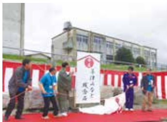
第7回 桂川・ 草津みなと はも海道まつり